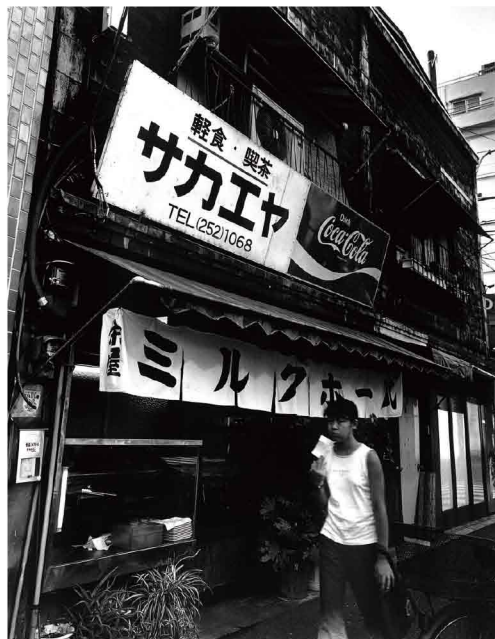
松村明写真集「路地を抜けると」より